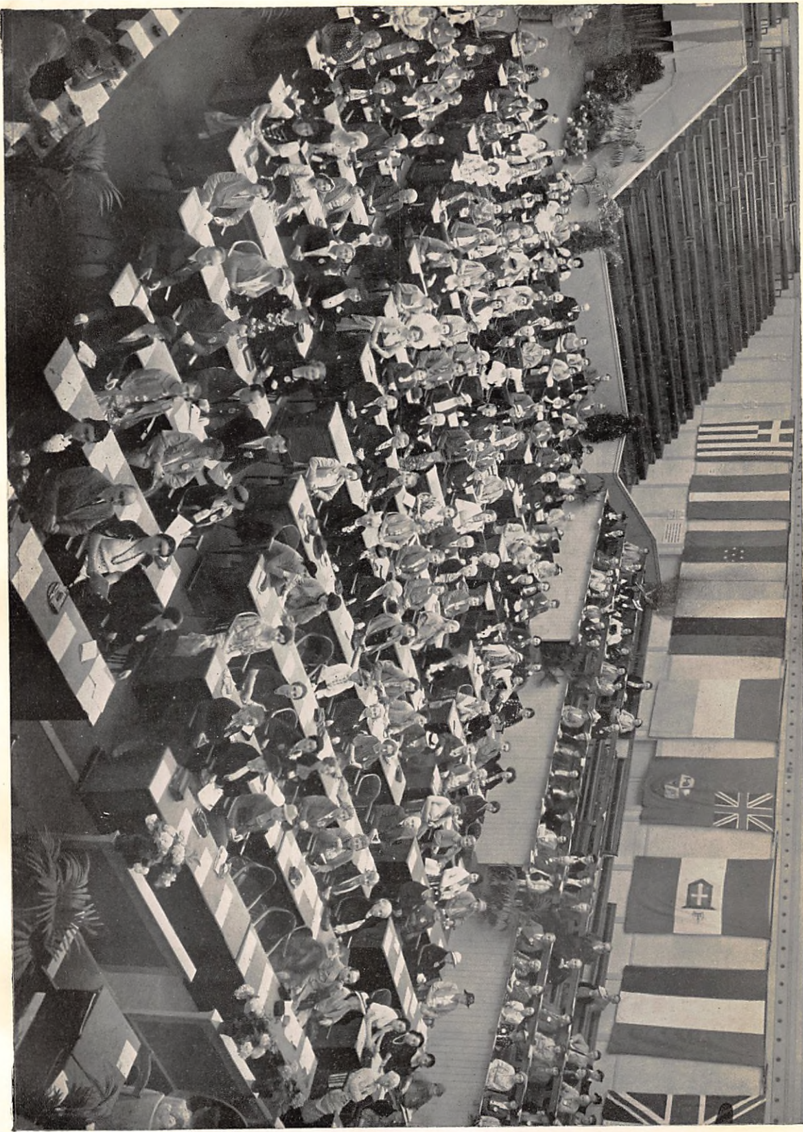
Geneva World Congress: Looking From the Rostrum